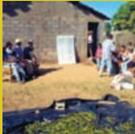
Garantir a participação igual entre homens e mulheres, respeitando os direitos da criança.

Como estratégia coletiva de inserção no mercado, os agroextrativistas, assessorados pelo CEDAC - Centro de Desenvolvimento Agroecológico do Cerrado, construíram uma Rede de Comercialização Solidária, se conscientizaram e já experimentaram a prática da erradicação do trabalho infantil, a igualdade nas relações de gênero, a conservação do Cerrado, a permanência dos agro-extrativistas no campo e a perspectiva de uma melhor qualidade de vida como consequência das próprias condições criadas por eles e para eles. Conheça este trabalho e se encante com os resultados.