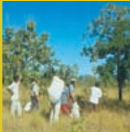
Manejar a faveira de forma correta.