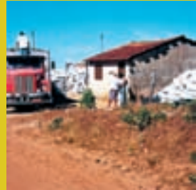
Comercializar diretamente para a indústria, melhorando a renda familiar.