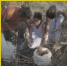
Menor remuneração pelo trabalho das mulheres