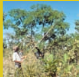
Garantir a perpetuação das formas de sobrevivência das populações agroextrativistas do Cerrado.