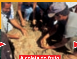
A coleta do fruto