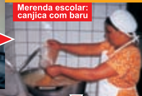
Merenda escolar: canjica com baru